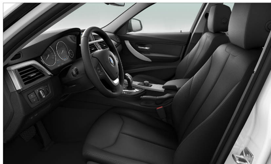
Sensatec皮質 / 標準座椅 320i