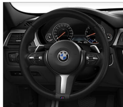
M款多功能真皮方向盤(含換檔撥片)