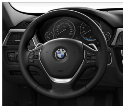
跑車多功能真皮方向盤(含換檔撥片)