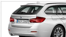
330i M Sport