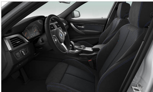
Alcantara麂皮/高級織布 / 跑車座椅 330i M Sport