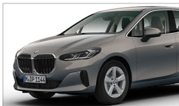
220i Active Tourer