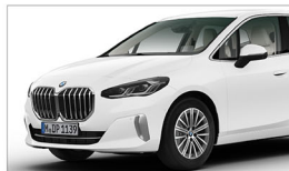
220i Active Tourer Luxury