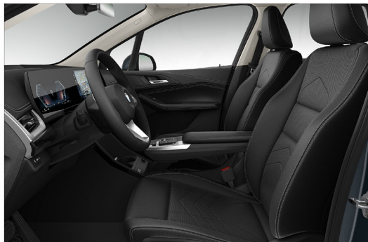
Sensatec 透氣皮質 / 標準座椅 220i Active Tourer