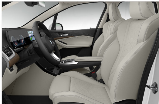
Sensatec 透氣皮質 / 跑車座椅 220i Active Tourer Luxury