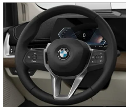
跑車多功能方向盤