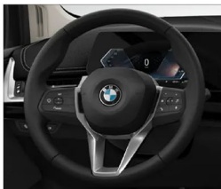
跑車多功能方向盤