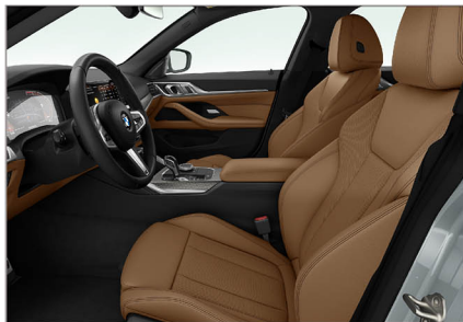
Sensatec 透氣皮質 / 跑車座椅 420i M Sport