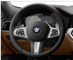
M 多功能真皮方向盤 (含換檔撥片)