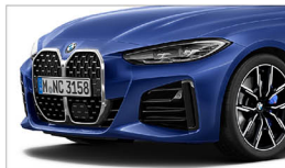
430i M Sport