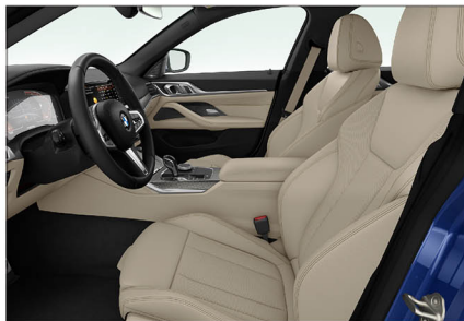
Sensatec 透氣皮質 / 跑車座椅 430i M Sport