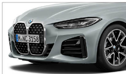
420i M Sport