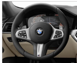
M 多功能真皮方向盤 (含換檔撥片)