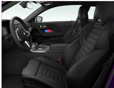
Vernasco 真皮 / M 跑車座椅 M240i xDrive