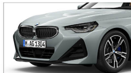
220i M Sport