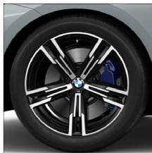
M 雙輻式 848M