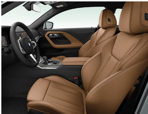
Sensotec 透氣皮質 / 跑車座椅 220i M Sport