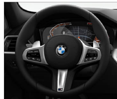
M多功能真皮方向盤 (含換檔撥片)