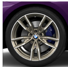
M 雙輻式 792M