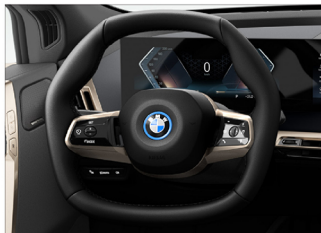
六角造型多功能真皮方向盤 xDrive40 旗艦版 / xDrive50 旗艦版