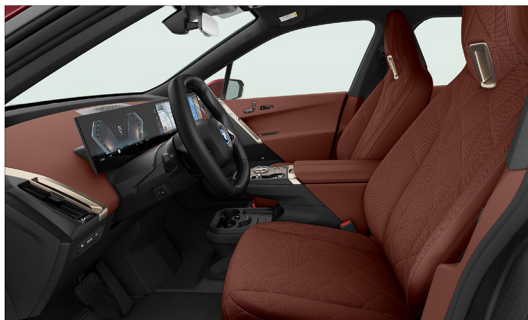
橄欖葉繻製天然真皮 / 一體式座椅 xDrive40 旗艦版 / xDrive50 旗艦版