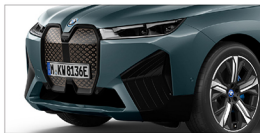
iX xDrive40 旗艦版