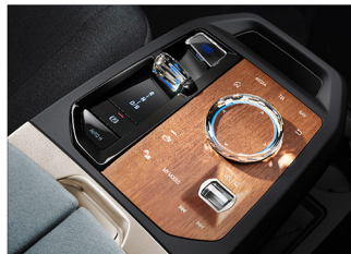
天然木紋飾板 xDrive40 旗艦版 / xDrive50 旗艦版