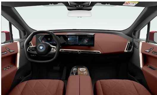
橄欖葉繻製天然真皮 / 一體式座椅 xDrive40 旗艦版 / xDrive50 旗艦版