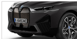
iX xDrive50 旗艦版