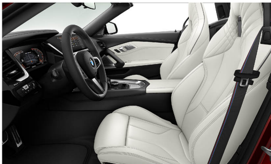
Vernasca 真皮 / M 跑車座椅 Z4 M40i