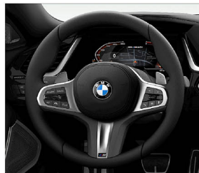
M款多功能真皮方向盤 (含換檔撥片)