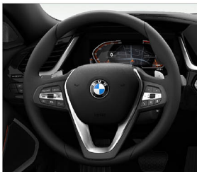
跑車多功能真皮方向盤 (含換檔撥片)