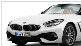
Z4 sDrive20i Sport Line